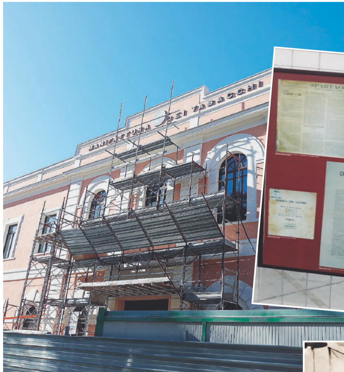
SEDE SIMBOLO Alla ex Manifattura tabacchi hanno lavorato centinaia di tabacchine fino al 1970. In basso una pagina dello Statuto del lavoratori